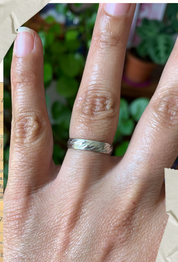
Mi anillo de bodas

Algún objeto que nos recuerde este momento